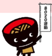
わんこきょうだい・そばっち

岩手県保健福祉部健康国保課 岩手県口腔保健支援センター 電話：019-629-5468 E-Mail：AD0003@pref.iwate.jp