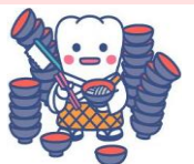
日本歯科医師会PRキャラクター「よ坊さん」岩手県バージョン