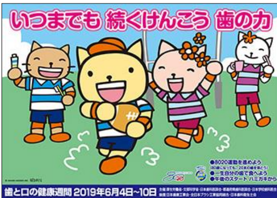
「第14回8020健康フェスタ」ポスター

今年度の標語は「 いつまでも 続くけんこう 歯の力 」となっています。多くの地域、関係者・機関での取組をお願いします。