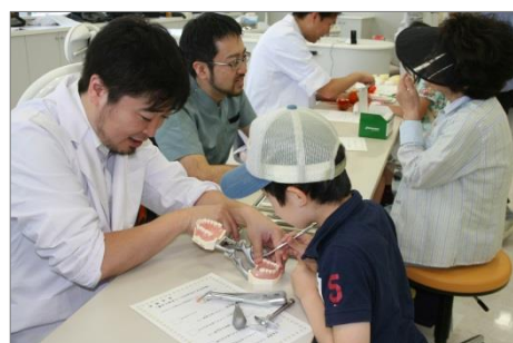
体験コーナーの様子

当センターも体験学習コーナーの一つとして「むし歯活動検査」を実施し、参加者に口腔衛生の意識を高めてもらいました。