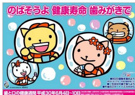
平成30年度「歯と口の健康週間」ポスター