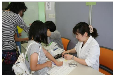
むし歯活動検査コーナーの様子