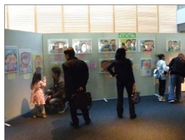
歯・口の健康に関する図画・ポスター・標語コンクール優秀作品展示

開場出入口前の広場に設けた「歯・口の健康に関する図画・ポスター・標語コンクール」及び「イー歯トープ笑顔の写真コンテスト」の優秀作品を展示するコーナーでは、来場者が優秀作品を観たり、被表彰者が家族と一緒に記念撮影をする姿などが見られました。