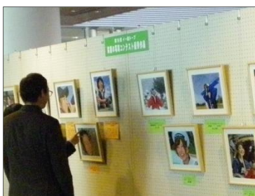
イー歯トープ笑顔の写真コンテスト優秀作品展示