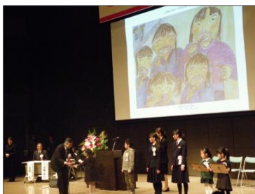
歯・口の健康に関する図画・ポスター・標語コンクール表彰の様子