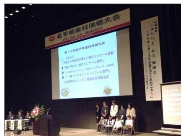
岩手県よい歯のコンクール表彰の様子