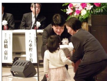
岩手県よい歯のコンクール表彰の様子