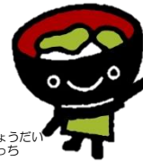
わんこきょうだいおもち

その他：11月12日（日）開催の「平泉町健康づくりのつどい」（会場：平泉町保健センター）に当センターから「いい歯の日ミニブース」を出展します。