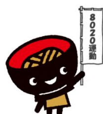
わんこきょうだいおもち

http://www.pref.iwate.jp/iryuu/kenkou/shika/027948.html