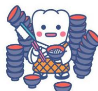
日本歯科医師会PRキャラクター「よ坊さん」岩手県バージョン