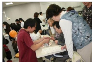
体験学習コーナー 「模型での抜歯体験」コーナー