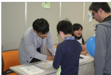
体験学習コーナー 「むし歯活動検査」コーナー