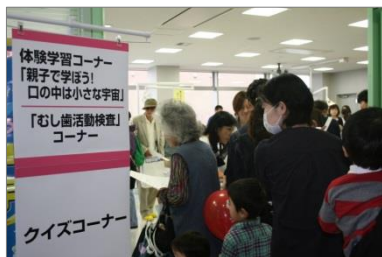
体験学習コーナー入り口の様子