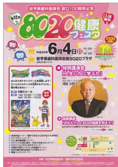
「第12回8020健康フェスタ」ポスター

当センターも体験学習コーナーの一つとして「むし歯活動検査」を実施し、参加者に口腔衛生の意識を高めてもらいました。