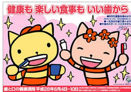
平成28年度「歯と口の健康週間」ポスター

ショッピングセンターやコミュニティーホールでは、歯科医師会や歯科衛生士会等による体験型のイベントや作品展が開催されました。また、市町村や保健所、学校等でも広報・ポスター等での啓発、歯みがき教室、歯科講話、歯科健診・相談等が実施されました。