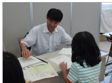
体験学習コーナー